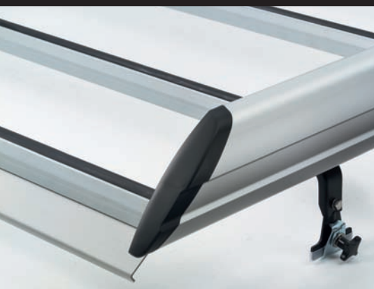
Aerodynamische vormgeving. Inclusief spoiler (optie).