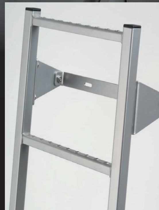
Deurladder voor praktisch laden en lossen.