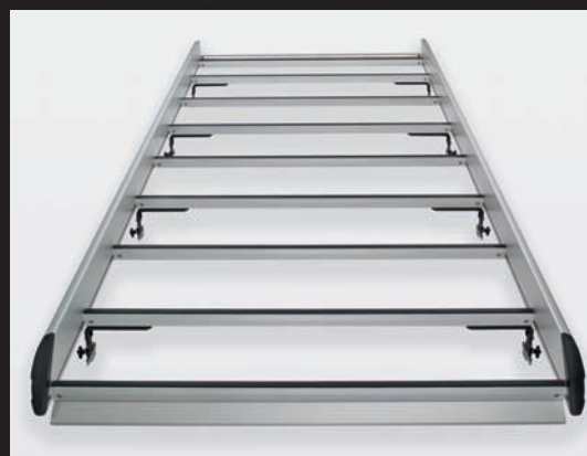
Aluminium imperiaal voor een lange levensduur.