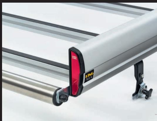
Reflecterende achterzijde. Inclusief laadrol (optie).